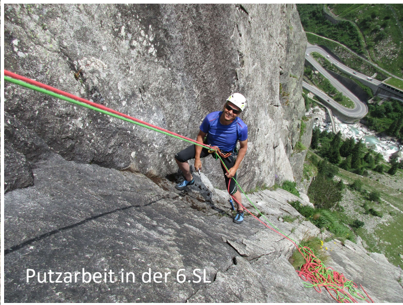
Putzarbeit in der 6.SL